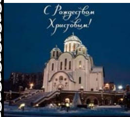
Храм Покрова Пресвятой Богородицы в Ясенево